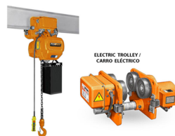
ELECTRIC TROLLEY / CARRIO ELECTRICO