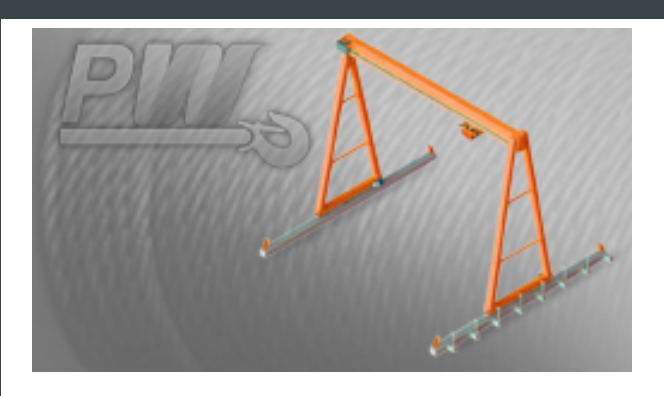
Porch Bridge 10 Tons