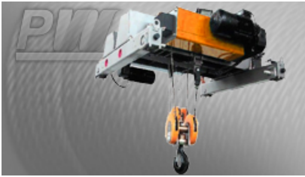
20 Tons Hoist Bridge with Hoist