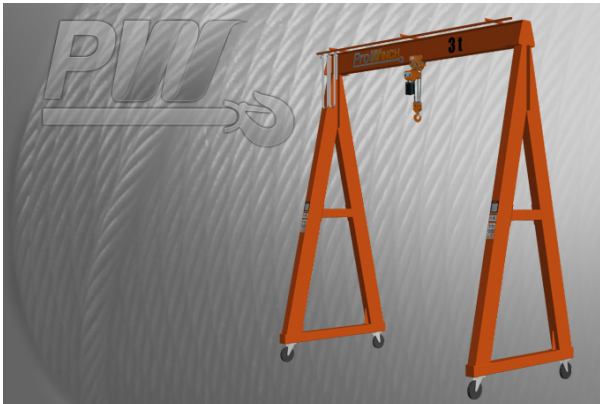
3 Tons Gantry Crane